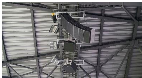
スタジアムスピーカー

ダイナミックな演出を可能にするLEDディスプレイと大歓声にも負けない パワフルな音響システムを有するスタジアム