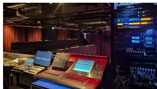
ライブレストラン 音響照明調整卓