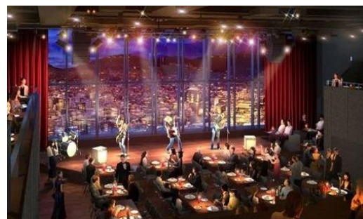
ライブレストラン『THE CLUB NAGASAKI』