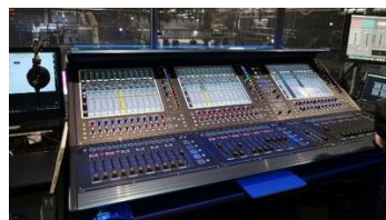
アリーナメイン音響調整卓