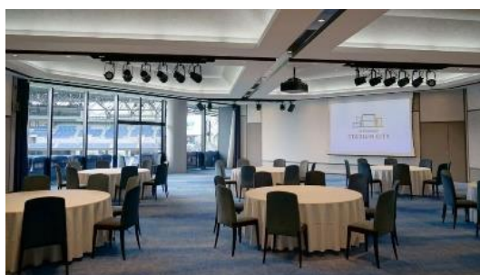
STADIUM CITY HOTEL NAGASAKI